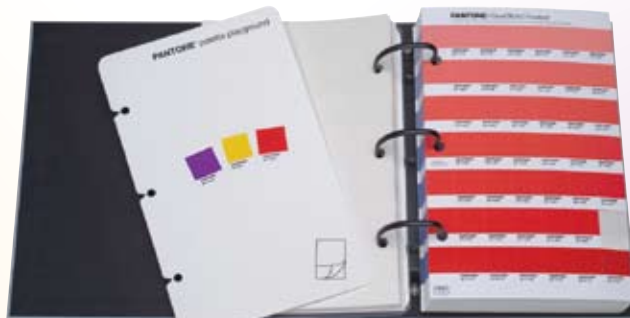
▲ パントン パレットプレイグラウンド