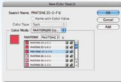
Adobe InDesign®でゴーカーを選択する