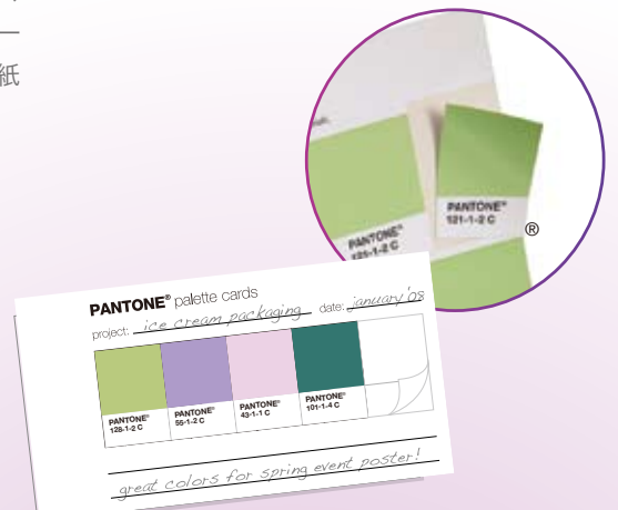
▲ パントン パレットカード