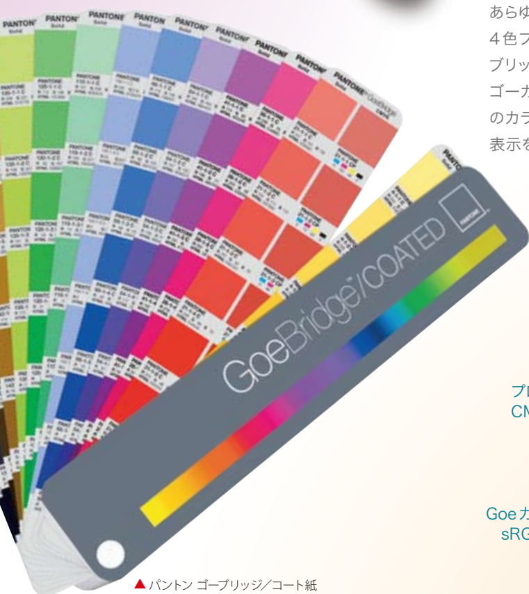
▲パントン ゴーブリッジ/コート紙

あらゆるデザイナーにとって重要な事は、選択したソリッドカラーを4色プロセスで印刷した時に、どう見えるかを知ることです。ゴブリッジは正確にゴーカラーの再現性を確認できるカラーガイドで、ゴーガイドに収録されているそれぞれのカラーについて、特色刷りのカラーを左に、その4色プロセス印刷での再現色を右に並列に表示をする事で、色合いを簡単に比較出来るようになっています。