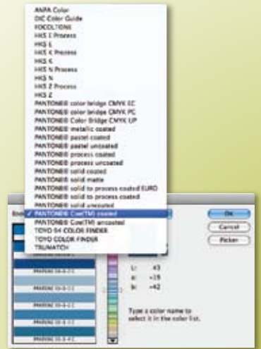
Adobe Photoshop®でゴーカーを選択する

フリー ダウンロード ゴージェジタルライブラリを 無償で、ダウンロード いただけます。