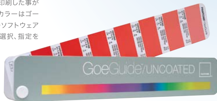
▲パントン ゴーガイド/上質紙

今までにパントンカラーを特色として指定、印刷した事がある方はもうご存知だと思いますが、ゴーカラーはゴーガイド/コート紙、上質紙、またはお使いのソフトウェア収録のゴードigitalライブラリを利用して選択、指定をしていただけます。ゴーガイドは他のソリッドカラーの色見本帳と比較し大変見やすく、ご希望の色を探し易くなっています。