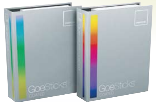
▲ パントン ゴースティック/コート紙

ゴーステムの色見本帳はそれぞれ単品でお求めいただけますが、ゴーガイドとゴースティックをセットにして専用ケース、「ゴークューブ」に収録したコンプリートセット、ゴーステム/コート紙、上質紙もそれぞれ用意されています。