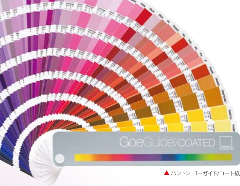
▲パントン ゴーガイド/コート紙