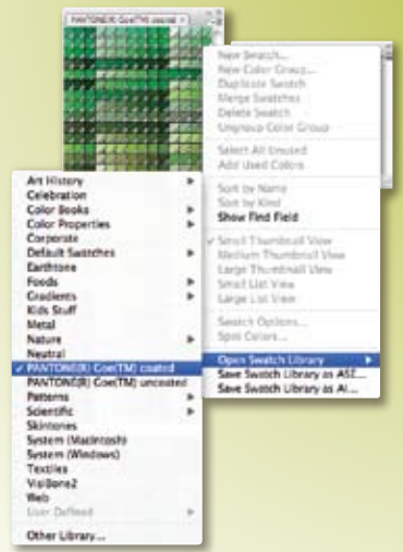
Adobe Illustrator®でゴーカーを選択する